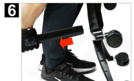
DÉTACHER LE RESSORT À GAZ EN LE TIRANT VERS L'EXTÉRIEUR