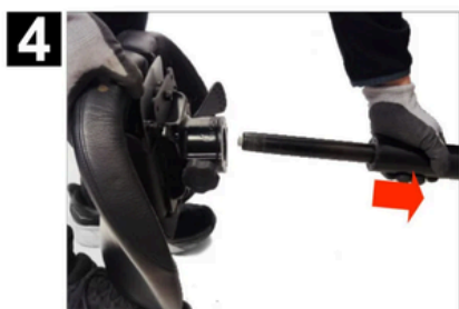
DÉTACHER LE RESSORT À GAZ EN LE TIRANT VERS L'EXTÉRIEUR