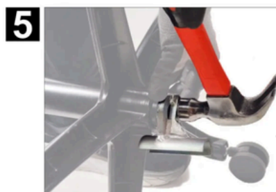
L'OUTIL DOIT ÊTRE FIXÉ À L'EXTRÉMITÉ INFÉRIEURE DU RESSORT À GAZ, PUIS LE MARTEAU DOIT ÊTRE ENFONCÉ DANS LA PARTIE SUPÉRIEURE DU RESSORT À GAZ