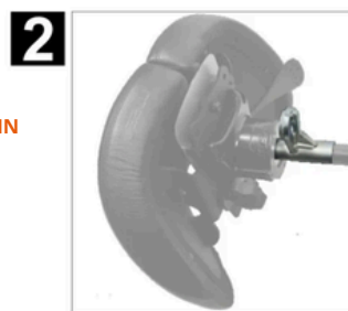
OUTIL DE RÉGLAGE SUR LE RESSORT À GAZ