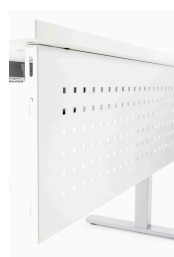
VOILE DE FOND